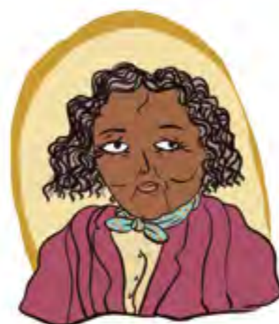
Nawal El Saadwi

Daktari kutoka Marekani na aliyenusurika ukeketaji.